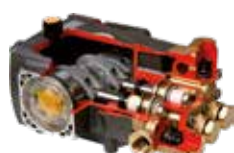
Bomba lineal y pistones cerámicos