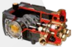
Bomba lineal y pistones cerámicos